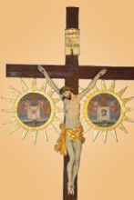
Planina pod Golico Sveti Križ