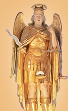
Dovje Sveti Mihael

Vabljeni, da praznik obhajamo v veliki hvaležnosti in češčenju Kristusa, ki ostaja med nami kot kruh življenja in vir upanja za naš čas.