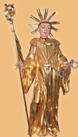
Jesenice Sveti Lenart