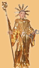
Jesenice Sveti Lenart