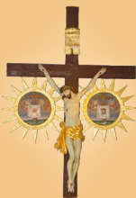
Planina pod Golico Sveti Križ