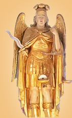
Dovje Sveti Mihael