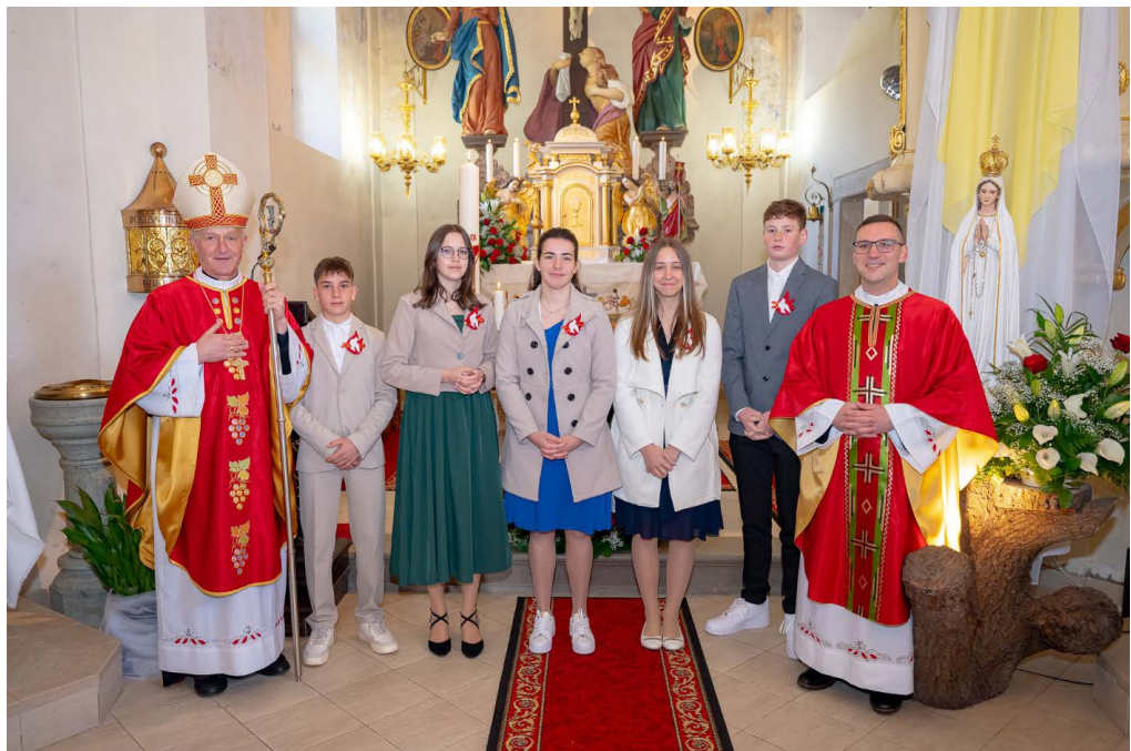
Skupinska fotografija birmancev pri Svetem Križu, birmovalca in župnika